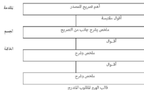
صورة 4 قالب الهرم المقلوب المتدرج

وهذا ما يعني أن الهرم المقلوب المتدرج أصلح القوالب الفنية في كتابة الأخبار القائمة على سرد التصريحات كما هو الحال في المؤتمرات الصحفية أو البيانات السياسية والندوات.. 10