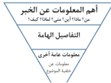
صورة 3 قالب الهرم المقلوب